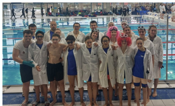
L'Equipe Interclubs Dames classée en Nationale 2